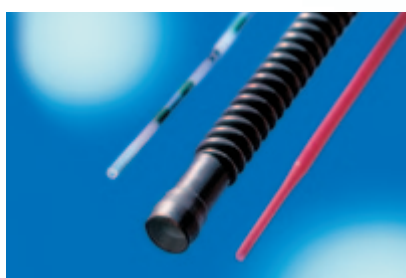
Tubos de PTFE