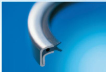
Retenores com lábio de vedação em PTFE