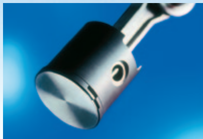
Anéis de segmento e elementos de guiamento