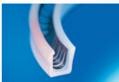
Vedações energizadas por mola