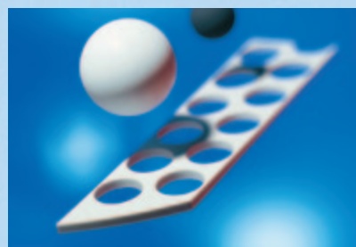
Elementos de construção