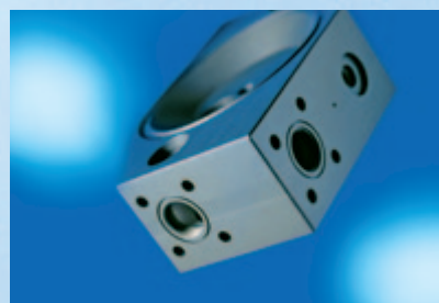
Carcaças para bombas